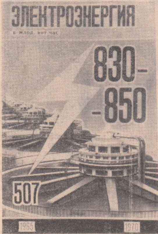
Производство электроэнергии в млрд. квт. час.